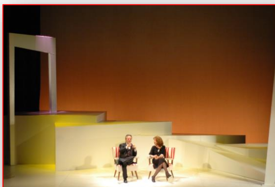
La comedia del bebe de Edward Albee. Dirección: Jesús Salgado