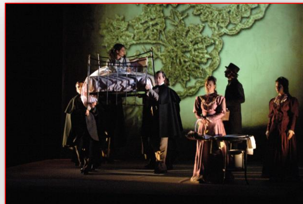
Despertar de primavera de Wedekind. Dirección: Jesús G a Salgado