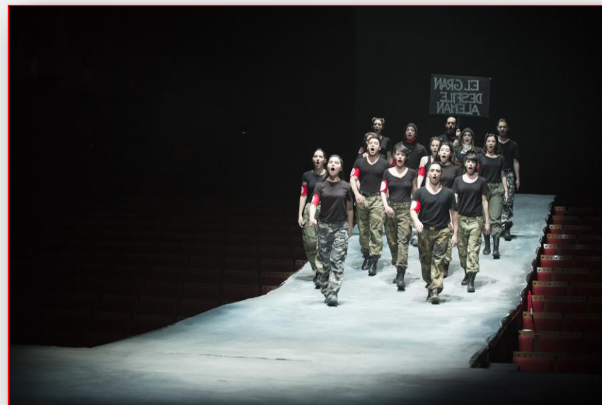
Terror y miseria del III Reich de Bertolt Brech. Dirección : Jesús G a Salgado

Desde 1993 imparte clases de Interpretación en la Escuela Superior de Arte Dramático de Madrid (RESAD), y hasta el 2008 en la ESAD de Torrelodones (Universidad de Kent, Canterbury), donde fue Director del Departamento de Interpretación y de Dirección de escena desde el 2000 al 2008.