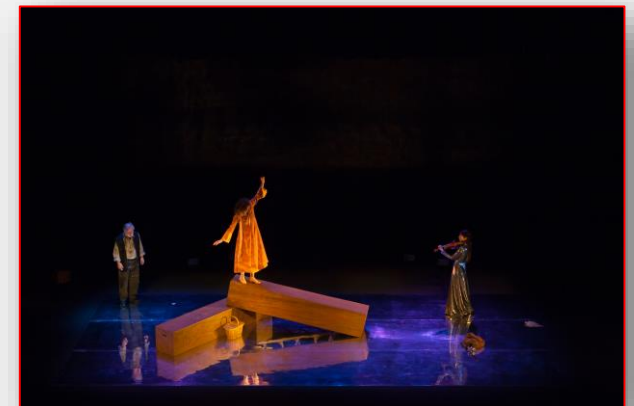
Nostalgia del agua de Ernesto Caballero. Dirección: Jesús G a Salgado.